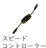
スピード コントローラー