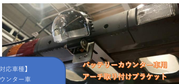
バッテリーカウンター車用 アーチ取り付けブラケット （別売）