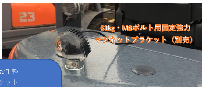
63kg・M8ボルト用固定強力 マグネットブラケット（別売）